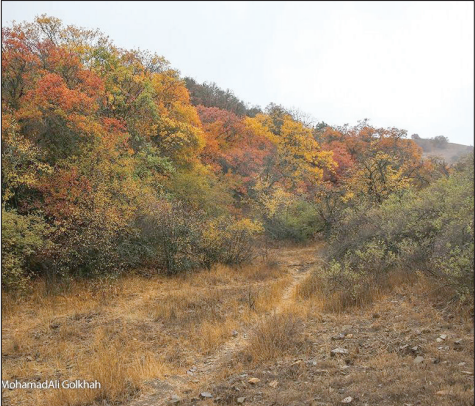
طبیعت بکر پارک ملی گلستان در پاییز