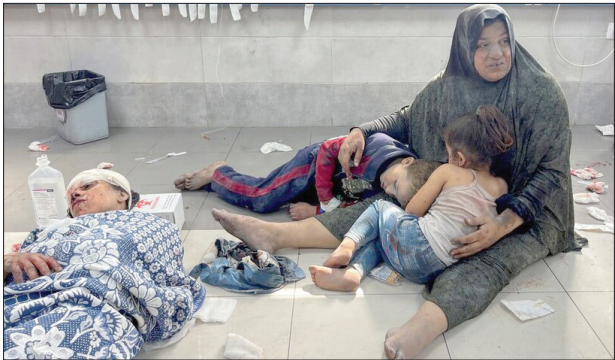
مادری فلسطینی به همراه فرزندانش در بیمارستان الشفاء غزه/روتیتر

ملاقات پر سروصدای رونالدو و بن سلمان، بن سلمان در این مراسم از راه اندازی و میزبانی جام جهانی ورزش های الکترونیکی از تابستان ۲۰۲۴ به صورت سالانه در شهر ریاض خبر داد/ همشهری آنلاین