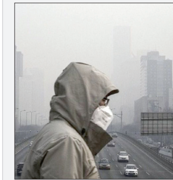
معاون توسعه منابع و پشتیبانی سازمان پژوهش و برنامه‌ریزی آموزشی خبر داد؛