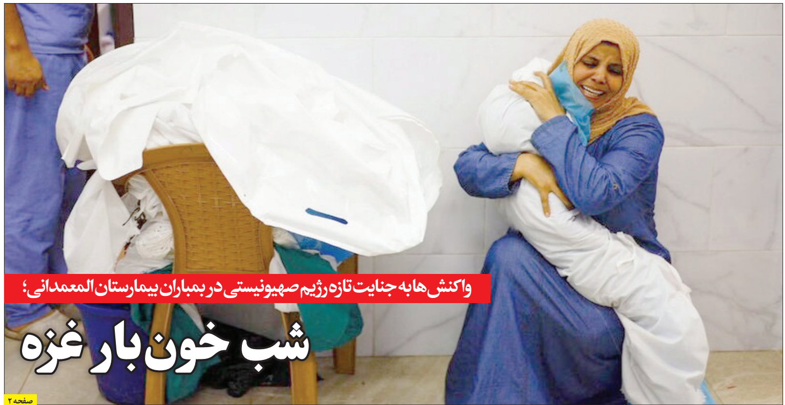
واکنش ها به جنایت تازه رژیم صهیونیستی در بمباران بیمارستان المعمدانی؛

صدور بخشنامه های متعدد و بعضاً ضدونقیض، دادخواهی کارگران در مراجع حل اختلاف را با دشواری مواجه می سازد. کارگری که ناعادلانه اخراج شده و شش ماه حقوق نگرفته، هیچ راهی جز مراجعه به هیات های حل اختلاف ادارات کار و دادخواهی