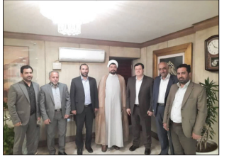
مهرنوش قره داغی / روزگار

دست پر نماینده مجلس ملایر برای گره کشایی از پروژه ۳ هزار راسی ملایر زمینه دریافت تسهیلات از بانک کشاورزی را فراهم آورد.