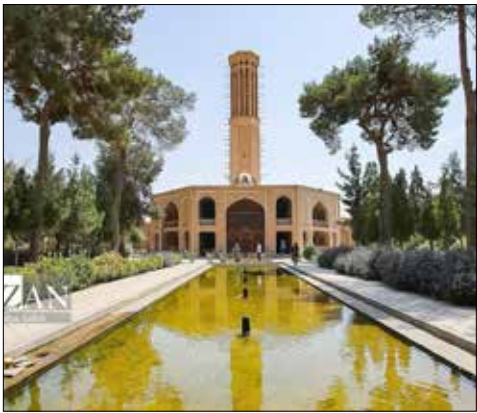
در کوچه و پس کوچه های یزد