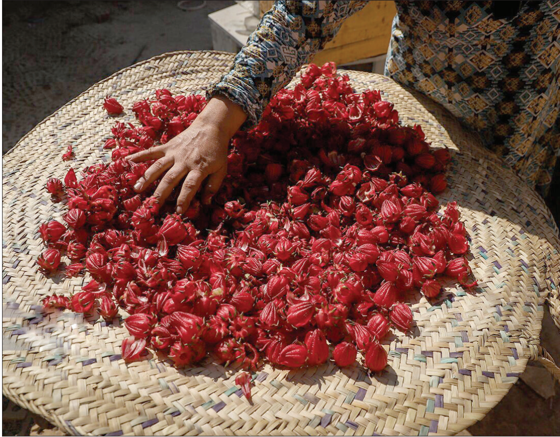
روستای «علوه» در ده کیلومتری شهرستان کارون یکی از قطب های برداشت جای قرمز (حمر) یا ترش است.

تفریحات کوپر رضا آباد تفریحات مناطق کوپری، اگر بیشتر از تفریحات مناطق سرسبز نباشند، چیزی کمتر هم ندارند. کافی است یک بار به کوپر رضا آباد سفر کنید تا از تفریحات بی نظیر و هیجان انگیز آن نهایت لذت را ببرید. پیاده روی روی تپه ها یا رمل های ماسه ای یکی از تفریحات سالم و رایگان کوپر رضا آباد که وجود هر گردشگری را از آرامش برمی کند، پیاده روی روی شن های گرم و نرم است. اگر از وجود موجودات در منطقه ای که می خواهید در آنجا قدم بزنید، بی اطلاع هستید، حتماً از گردش مناسب استفاده کنید. در غیر این صورت، احتمال گزیدگی توسط عقرب یا دیگر موجودات وجود دارد. قدم زدن روی ماسه های روان کوپر رضا آباد کمی سخت است؛ زیرا با هر قدم پاها و میج ها به درون ماسه ها فرو می روند. اگر قصد پیاده روی دارید سعی کنید زیاد از هم سفرهای خود فاصله نگیرید.