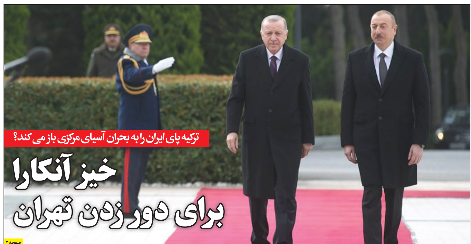
تزیه پای ایران رابه بحران آسیای مرکزی باز می کند؟

با افزایش نرخ ارز و نوسان انس جهانی در یکسال گذشته، قیمت طلا و سکه نیز متأثر از قیمت این بازارها روندی افزایشی را می بینیم. اقدام به خرید چنین کالاهایی کنند، چرا که نرخ دلار به بیش از ۵۸ هزار تومان رسید و بدنبال آن سکه نیز از مرز ۳۳ میلیون تومان عبور کرد.