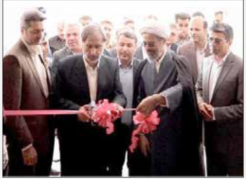
این موضوع تاکنون دومدرسه بنام شهدای بانک مسکن در استان محروم خراسان شمالی ساخته است. استاندار خراسان شمالی گفت: بانک مسکن با پرداخت حدود ۹۰