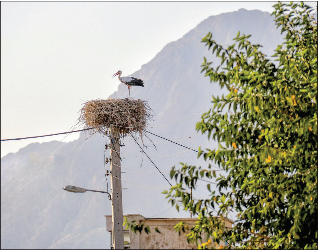
روستای «خوشینان علیا» میزبان لک ک‌ها