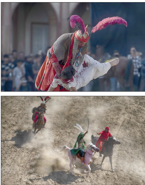
مقتل خوانی در امامزاده شاه گرم اصفهان