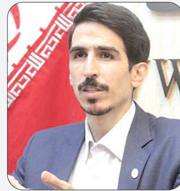
عضو کمیسیون انرژی مجلس: