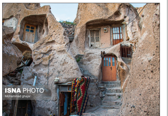
روستای کندوان - تبریز