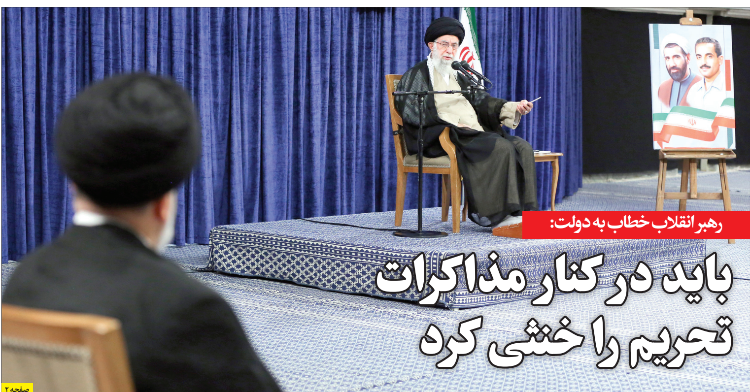
رهبر انقلاب خطاب به دولت: