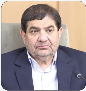
مخبر در جلسه هیات دولت: