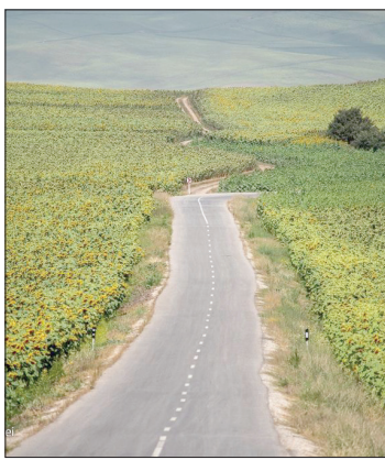
مزارع آفتابگردان استان گلستان