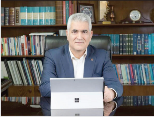
به هموطنان عزیز بوده و برای خرید ارز نیازی به افتتاح و یا داشتن حساب نیست. وی افزود: فروش ارز به زائرین بالای ۵ سال و به هر

دکتر بهزاد شیری مدیرعامل پست بانک ایران گفت: از روز شنبه ۲۸ مردادماه، زمان شروع فروش ارز در شعب و باجه های پست بانک ایران تا روز جمعه سوم شهریور ماه ۱۴۰۲، به ۱۴۰ هزار نفر از زائران ابعبدالله الحسین (ع) ارز اربعین و به مبلغ ۲۸ میلیارد دینار عراق فروخته شده است. دکتر شیری افزود: پست بانک ایران تمهیدات ویژه ای برای تسهیل و دسترسی فروش ارز اربعین در سال ۱۴۰۲ اتخاذ کرده است و در این رابطه نسبت به فعال سازی ۹۸۵ شعبه و باجه منتخب در سراسر کشور برای فروش ارز اربعین به زائران اقدام کرده است. مدیرعامل پست بانک ایران اظهار کرد: در این رابطه ۷۱۵ باجه روستایی بانک در سراسر کشور برای فروش ارز اربعین تعیین شده که با توجه به گستره جغرافیایی حضور آنها دسترسی و سهولت بیشتری برای زائران جهت خرید ارز ایجاد شده است. دکتر شیری در ادامه تاکید کرد: تمامی ۹۸۵ شعبه و باجه پست بانک ایران در روزهای تعطیل نیز به صورت کشیک فعال بوده و آماده ارائه خدمات