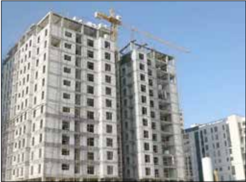
ساخت خانه‌های کوچک‌متر از در سال‌های اخیر موضوع مدنظر برخی از مسئولان بوده است. در مقابل، برخی دیگر مخالف ساخت این خانه‌ها هستند و می‌گویند ساخت خانه با متر از پایین تنها

در چند سال اخیر بازار مسکن با شوک‌های قیمتی زیادی روبه‌رو بوده است؛ کارشناسان یکی از عوامل این اتفاق را عدم تناسب میان عرضه و تقاضا می‌دانند و معتقدند که با وجود عرضه به میزان کافی، تقاضایی وجود ندارد و این به علت قیمت بالای خانه‌های عرضه شده است که متقاضیان توان خرید آن را ندارند. به همین منظور برخی از کارشناسان اقتصاد برای حل این مشکل ساخت خانه‌های کوچک‌متر از یک میکرو آپارتمان‌ها را پیشنهاد می‌دهند. خانه‌هایی که به اعتقاد آن‌ها می‌تواند نیاز اولیه افراد را برآورده و آن‌ها را زودتر به رویای خود برساند. رئیس بخش مسکن مرکز تحقیقات وزارت راه و شهرسازی نیز در روزهای گذشته در یک برنامه اینترنتی، یک خانه ۲۵ متری را برای حداقل‌های زندگی کافی دانسته و گفته است که براساس مقررات ملی ساختمان، ۲۵ متر فضا برای ساخت یک واحد مسکونی که تامین‌کننده نیازهای خوردن، خوابیدن و آشپزی افراد باشد، کافی است. هر چند وزارت راه و شهرسازی این مساله را تکذیب کرد، اما همواره