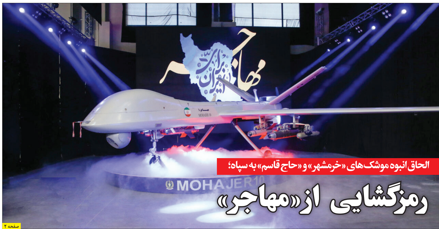
الحاق انبوه موشک‌های «خرمشهر» و «حاج قاسم» به سپاه؛ رمزگشایی از «مهاجر» | صفحه ۲