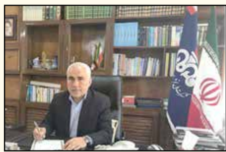
صورت داشتن هر گونه انتقاد یا پیشنهاد به صورت شایسته روزی با سامانه مرکز پاسخگویی ۰۹۶۲۷ تماس بگیرند تا در اسرع وقت نسبت به پیشنهادات و انتقادات آن عزیزان رسیدگی شود.

نخست سال گذشته تا تیر ماه امسال، ۱۴ درصد افزایش داشته است. مدنی افزود: تمامی نازل های فعال در منطقه به طور مستمر طی چند نوبت در ماه توسط کارشناسان مهندسی و کنترل کیفیت منطقه مورد آزمون و تست سنجی قرار می گیرند. مدیر منطقه اردبیل ضمن اشاره به پیش عملکرد جایگاه های عرضه سوخت آستان به صورت ماهانه، خاطر نشان کرد: شهروندان عزیز می توانند در صورت داشتن هر گونه انتقاد یا پیشنهاد به صورت شایسته روزی با سامانه مرکز پاسخگویی ۰۹۶۲۷ تماس بگیرند تا در اسرع وقت نسبت به پیشنهادات و انتقادات آن عزیزان رسیدگی شود.