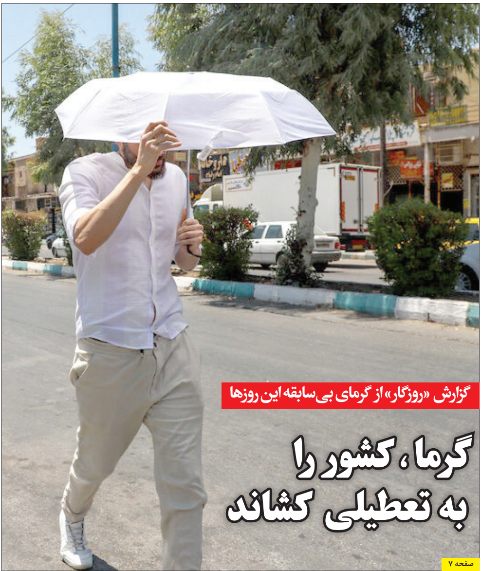
گزارش «روزگار» از گرمای بی سابقه این روزها