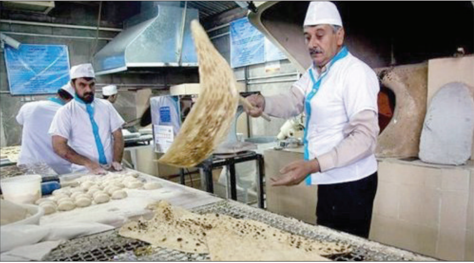
نانوايان در حال پخت نان در کارخانه

آرد يارانه‌اى مى‌شود تا نيازى از مردم بدون پاسخ نماند. وي با بيان اينکه در اين سازو کار دقت شناورسازى تخصیص آرد مبتنى بر تدبير سال گذشته طرفتى براى مديران استانى مى‌کند تا در بازه زمانى خاص که شاهد جابه‌جايى جمعى هستيم، مشکلى ايجاد نشود، گفت: تا دهم خردادماه در سامانه استان‌ها (مدىرانى استانى و کارگروه‌هاى آرد و نان استان‌ها) اختيار کامل تعريف شده تا براساس تشخيص ميدانى درباره تخصیص آرد تصميم بگيرند و مساله صف‌هاى نامتعارف که در تعداد معدودى از استان‌ها مشاهده مى‌شده، به سرعت در حال مرتفع شدن است.