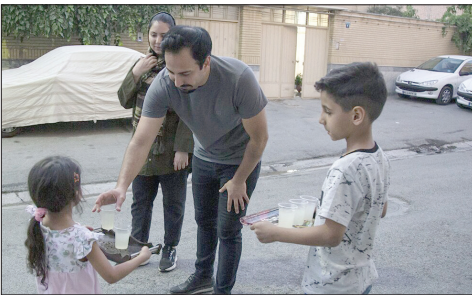
موکب داران کوچک