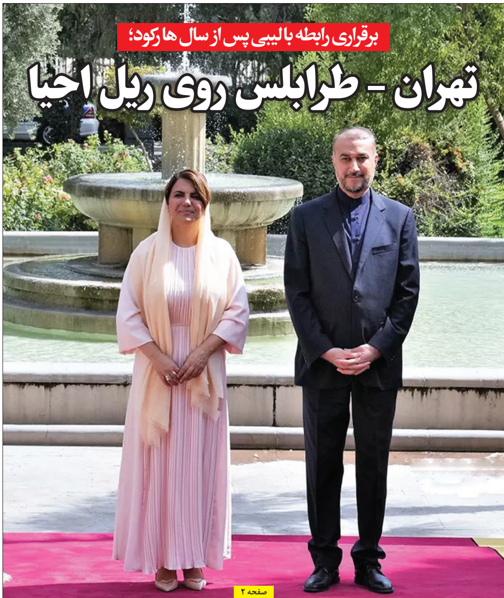
برقراری رابطه بالیبی پس از سال ها رکود؛

وقتی افزایش گرما اعصاب مردم را به هم می ریزد عبور از نقطه جوش در فصل گرما