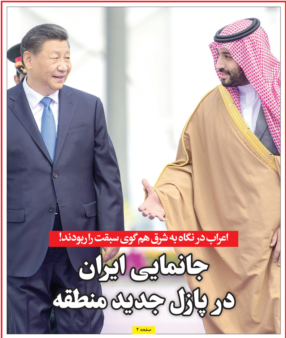
اعراب در نگاه به شرق هم گوی سبقت را ربودند!