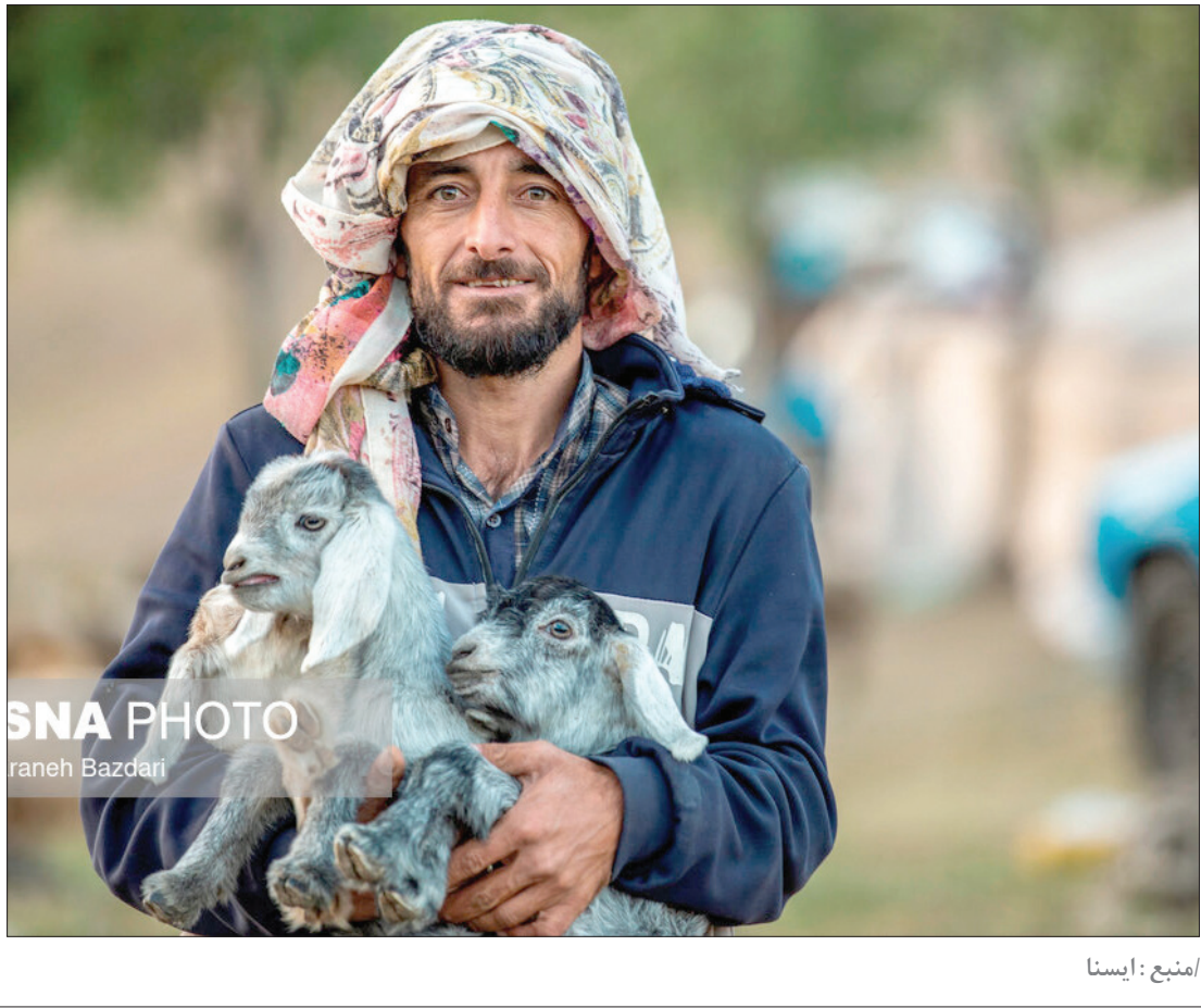
عشایر کوچ‌رو، مردمانی سخت‌کوش با زندگی ساده و بی‌آلایش