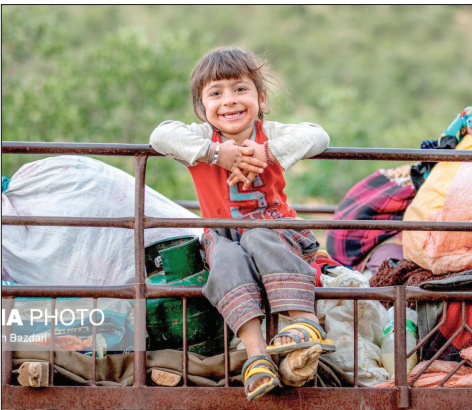
عشایر کوچ‌رو، مردمانی سخت‌کوش با زندگی ساده و بی‌آلایش