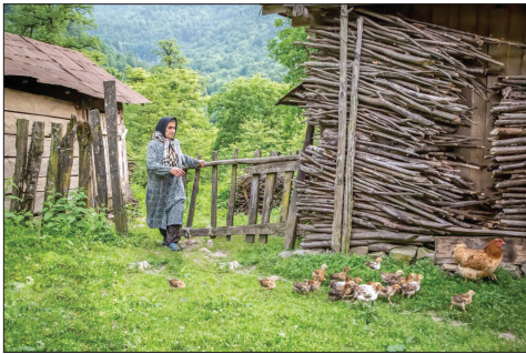
زندگی در ارتفاعات جنگل‌های هیرکانی