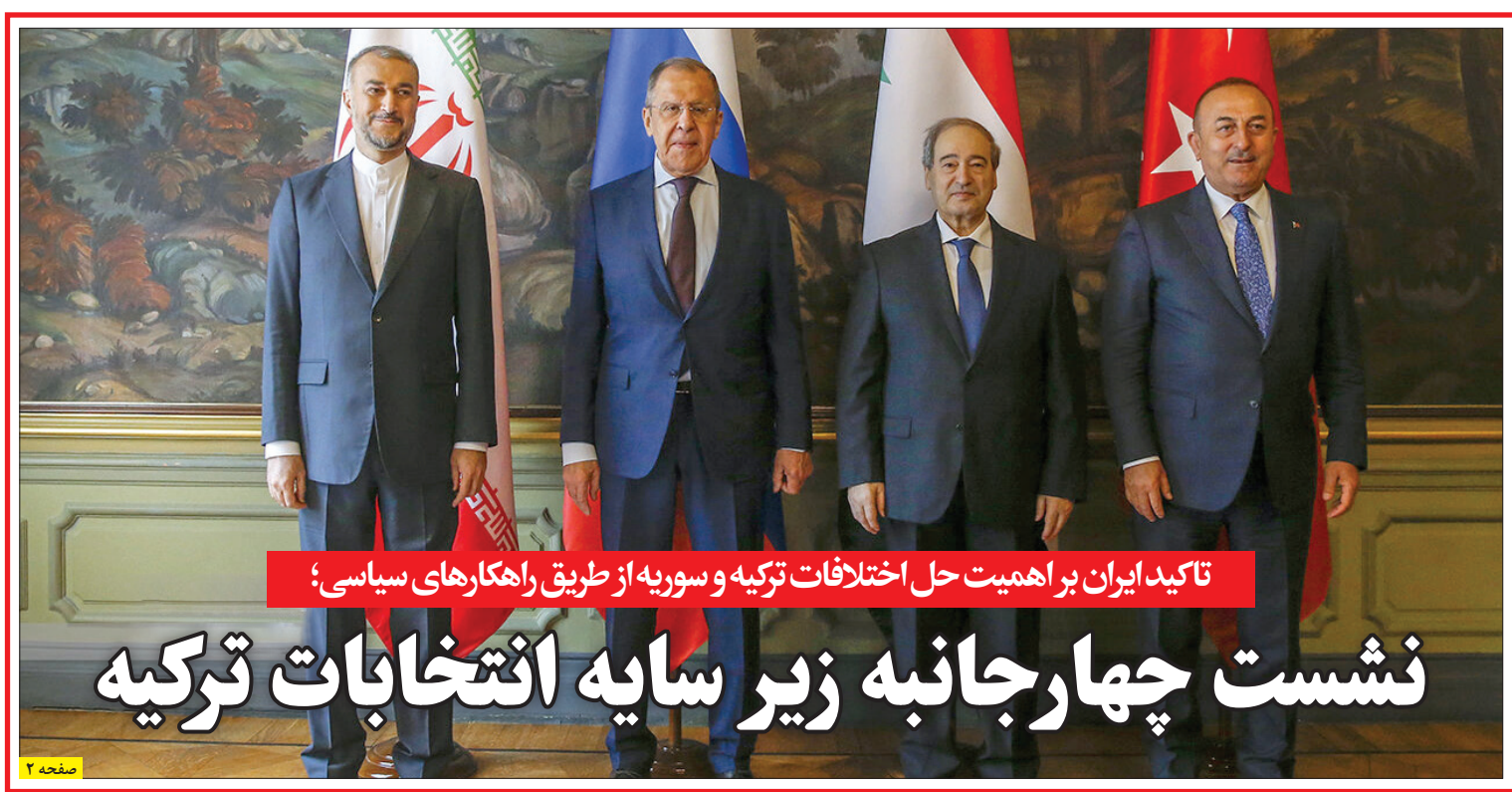
تاکید ایران بر اهمیت حل اختلافات ترکیه و سوریه از طریق راهکارهای سیاسی؛ نشست چهارجانبه زیر سایه انتخابات ترکیه