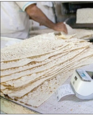
اسماعیل شجاعی سخنگوی شورای رقابت

اسماعیل شجاعی سخنگوی شورای رقابت در این ارتباط اعلام کرد که «در حال حاضر زمینه برای واردات خودرو از سوی فعالان و تجار به شکل گسترده فراهم نیست و دستورالعمل به شکلی بود که فقط خودروسازان اجازه واردات داشتند که این موضوع فضا را محدودش کرد. قیمت‌های سرسام‌آور خودروهای خارجی در ایران ناشی از اختلال در بازار واردات است.»