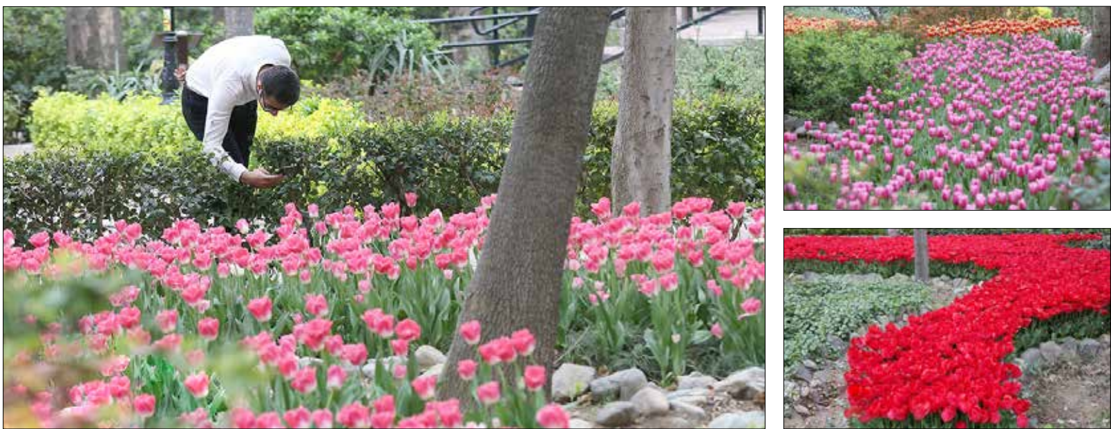
باغ ایرانی، بهشتی پنهان در قلب پایتخت