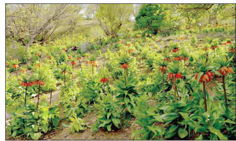
دشت لاله‌های واژگون، ارتفاعات مانشت ایلام