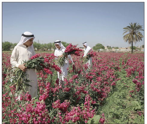
برداشت گل در حمیدیه، استان خوزستان