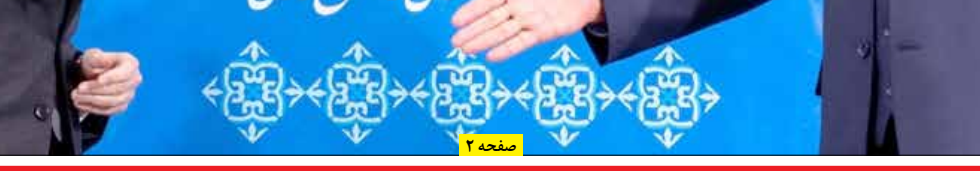
رئیس سازمان انرژی اتمی کشور: همکاری با ایران ادامه دارد