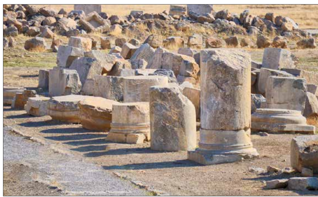
▲ معبد آناهیتا یکی از جاهای دیدنی شهرستان کنگاور در استان کرمانشاه است که از آن به‌عنوان دومین بنای بزرگ سنگی ایران بعد از تخت جمشید یاد می‌شود