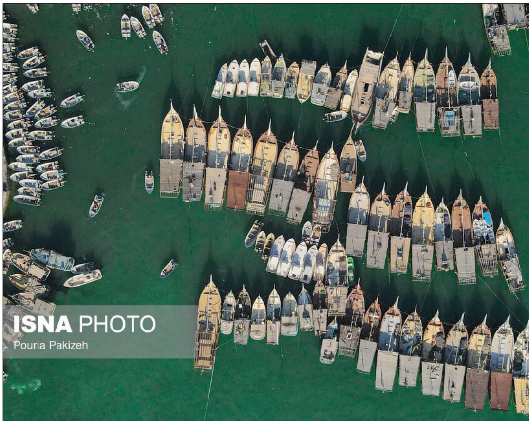
▲ «کنگ»، بندری زیبا و تاریخی