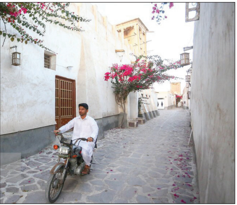
▲ «کنگ»، بندری زیبا و تاریخی