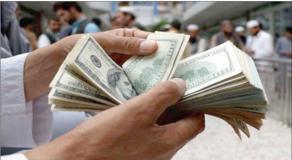
دلار در کانال تلگرامی

این کالا روی آورده اند. طبق بررسی هاعلت هجوم سرمایه گذاران و یا افرادی که اندوخته‌ای دارندومی خواهند آن را به سکه و ارز تبدیل کنند تا ارزش آن را رشد نرخ تورم حفظ شود، به دلیل وجود کانالهای مختلف تلگرامی نامعتبر و نرخ گذاری‌های غیرواقعی و کاذب آنهادر فضای مجازی چون قیمت دلار فریادی...است که این رقم‌های من درآوردی اما تاثیرگذار، اذهان عمومی را تشویق و بازار را مشتنج می‌کند، وجود کانالهایی که این روزها نه تنها بر افزایش نرخ ارز و سکه موثر بوده است بلکه مرجع مشاهده قیمت خیلی‌ها برای دستیابی به آخرین نرخ گذاری دلار و انواع ارز شده در حالی که چنین رقم‌های غیر واقعی چه بسا ممکن است منجر به سوخت سرمایه سرمایه گذاران ارز و طلا شود.