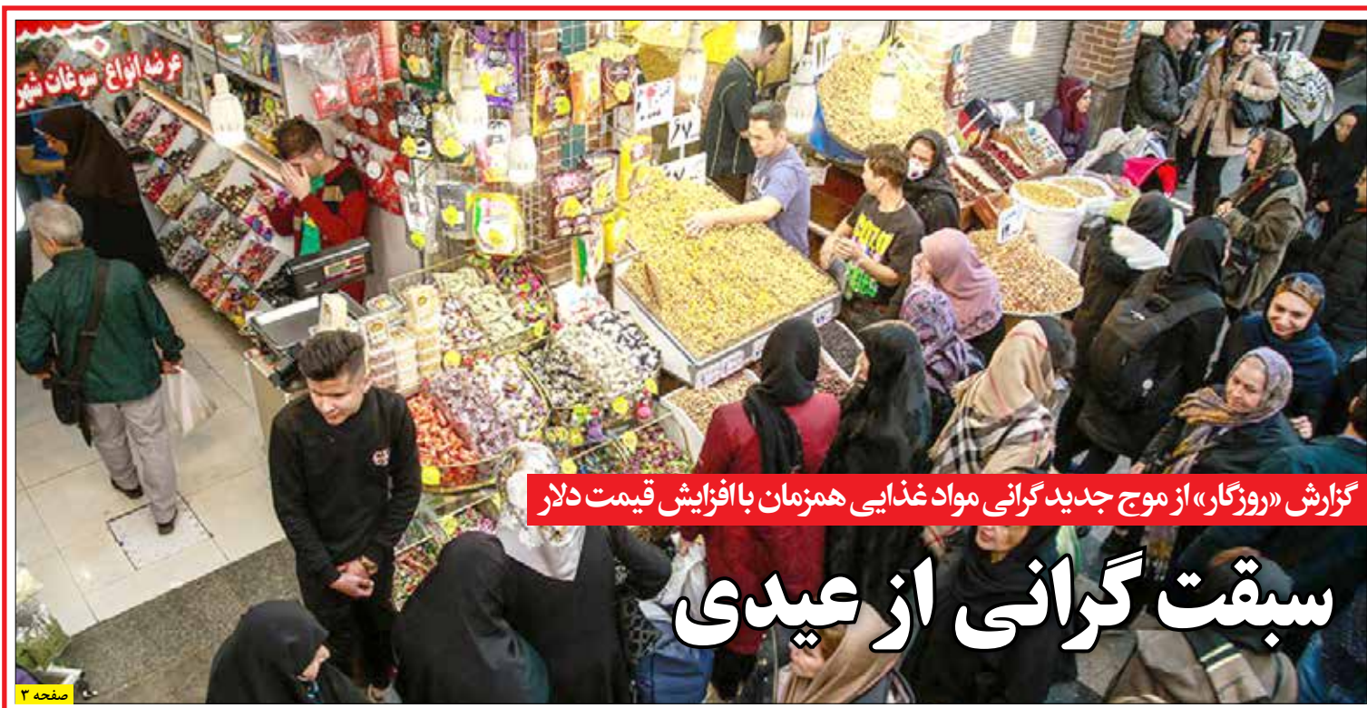
گزارش «روزگار» از موج جدید گرانی مواد غذایی همزمان با افزایش قیمت دلار