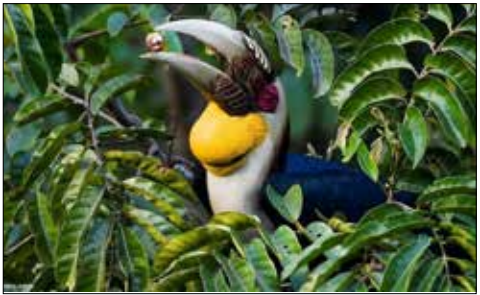
تصاویر منتخب حیات وحش در هفته گذشته