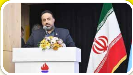
خود باوری، کلید درخشش پتروشیمی شازند: