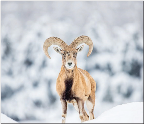
قوچ ها و میش های گلندوک