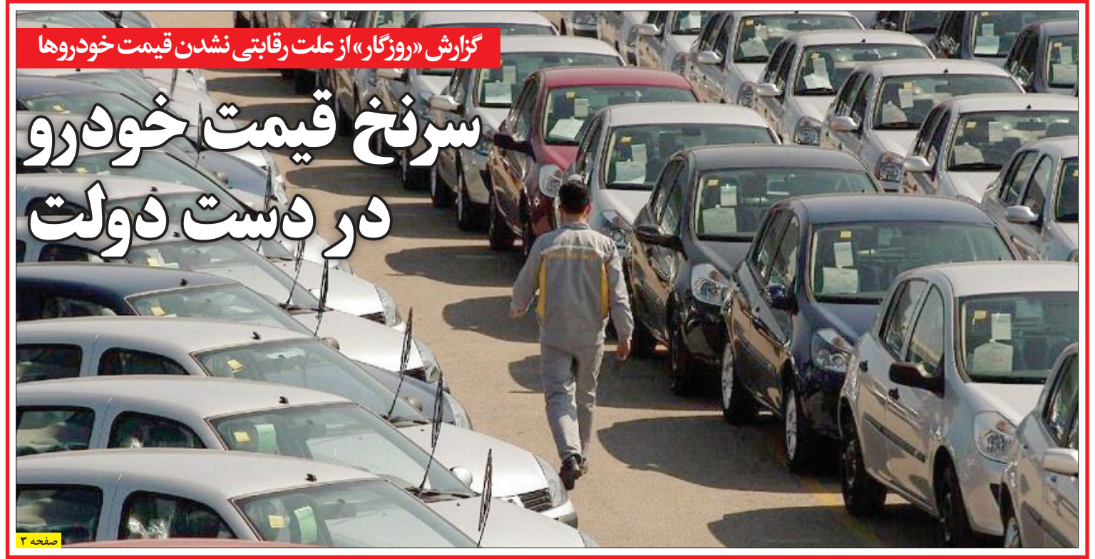
گزارش «روزگار» از علت رقابتی نشدن قیمت خودروها

کنعانی، سخنگوی وزارت امور خارجه گفت: در صورت جدیت عربستان، ایران آماده ارتقای سطح گفت‌وگوها از سطح امنیتی به سیاسی و حتماً علاقمند به بازگشت روابط عادی دو کشور به حالت گذشته است. وی افزود: چنانچه تمرکز مذاکرات ایران و عربستان بر منافع دو