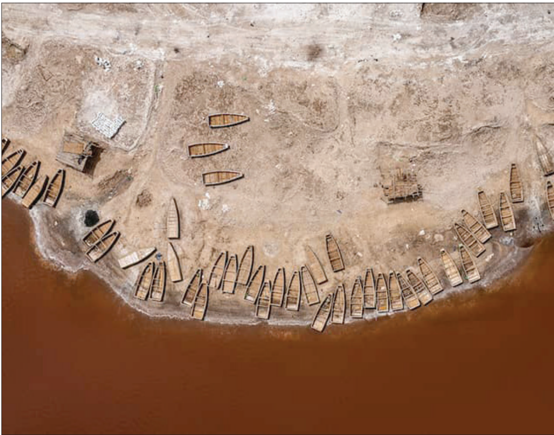
▲ عکاسی خوش ذوق اقدام به عکاسی از حوضچه های نمک کرده که نتیجه آن تصاویری شبیه به نقاشی های زیبای انتزاعی است.