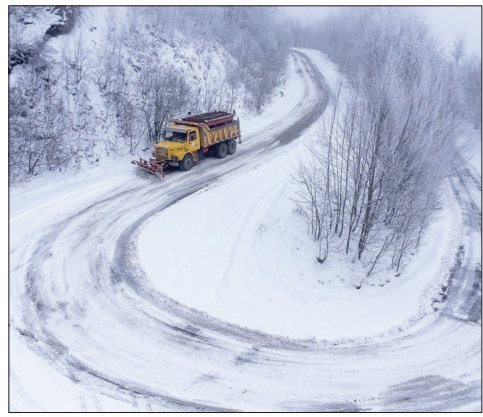
▲ طبیعت برفی جاده اولنگ رامیان در گلستان