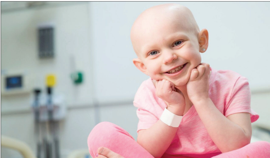
زهار روزی/ گروه جامعه

سرطان یک اصطلاح عمومی برای طیف وسیعی از بیماری‌هاست که می‌تواند هر یک از اندام‌های بدن را در برگیرد. یکی از مهم‌ترین ویژگی‌های سرطان رشد و تکثیر غیر طبیعی سلول‌ها و حمله و سرایت آن به سایر اندام‌هاست که متاستاز نام دارد و عامل اصلی مرگ ناشی از سرطان است. سرطان دومین علت مرگ و میر در جهان بعد از بیماری‌های قلبی عروقی است. افزایش نرخ مرگ و میرهای ناشی از سرطان به احتمال زیاد نتیجه پیری و افزایش جمعیت است. از طرفی خوشبختانه، پیشرفت در درمان سرطان‌ها نیز با سرعت زیاد ادامه دارد به همین دلیل در مقایسه با گذشته، بسیاری از افراد که به سرطان مبتلا می‌شوند عمر بیشتری دارند و یا در مان می‌شوند.