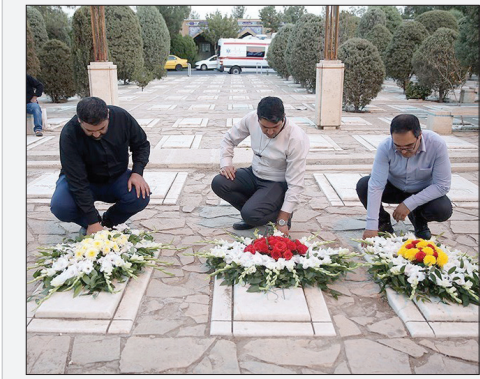
کوتاه از جامعه

قنبری مطلق درباره برنامه‌های وزارت بهداشت و درمان و مراقبت‌های