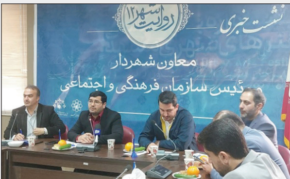
مشهد / محمد رضا رحمتی معاون شهردار و رئیس سازمان اجتماعی و فرهنگی شهرداری مشهد گفت: از امروز در شهر مشهد فعالیت های متنوعی شروع می شود؛ برنامه های دهه فجر، ایام جشن شعبانیه، استقبال از بهار و ماه رمضان در پیش رو است. حسین باغعلگی در نشست خبری با اصحاب رسانه، اظهار کرد: با توجه به مناسبت های پیش رو، از امروز در حوزه فرهنگی شهر مشهد فعالیت های زیادی آغاز می شود. وی با بیان اینکه تمام معاونت ها موظف شدند بر برنامه های

اختصاصی دهه فجر داشته باشند، افزود: با باشگاه های ده گانه ویژه