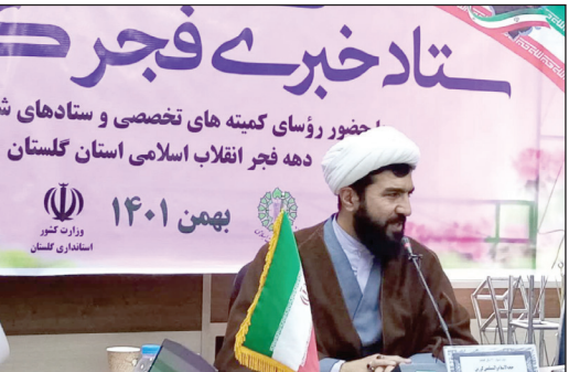
حضور روسای کمیته های تخصصی و ستادهای شاد دهه فجر انقلاب اسلامی استان گلستان

اجرای برنامه ۱۰ شب ۱۰ مسجد با بیش از ۱۴۰۰ برنامه، استفاده از ظرفیت شکل دختران حاج قاسم که ۵۰۰ نفر عضو دارد در این ایام و جشنواره قرآنی کودک و نوجوان از مهم ترین برنامه های این ستاد در دهه فجر انقلاب است. گرزین با بیان اینکه امام خمینی (ره) یک هنرمند واقعی پس از پیروزی انقلاب در اداره کشور بود، اظهار کرد: شخصیتی که بتواند هم در فقه، سیاست، فلسفه، مدیریت و هم در اخلاق و تاریخ شناسی و اسلام شناسی سرآمد باشد بدون شک یک هنرمند واقعی است. وی ادامه داد: با تشکیل گروه ها و شکل های مردمی در بخش های مختلف از ابتدای انقلاب همواره در عرصه های مختلف که دشمنان مشکلات زیادی را در تمام این ۴۴ سال برای کشور ایجاد کردند یکی از راهکار هالی بود که همپیش کشور را از بحران های مختلف نجات داد و پس از ایشان با مدیریت مقام معظم رهبری این شکل ها همچنان تقویت شد و تا به امروز