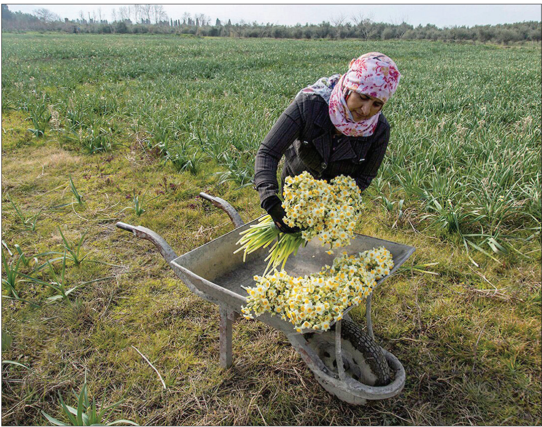
▲ برداشت گل نرگس از بزرگترین باغ یکپارچه گل نرگس شمال کشور در شهر آزادشهر