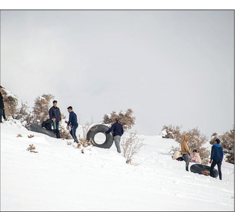
▲ طبیعت برفی جاده چله گاه در فارس