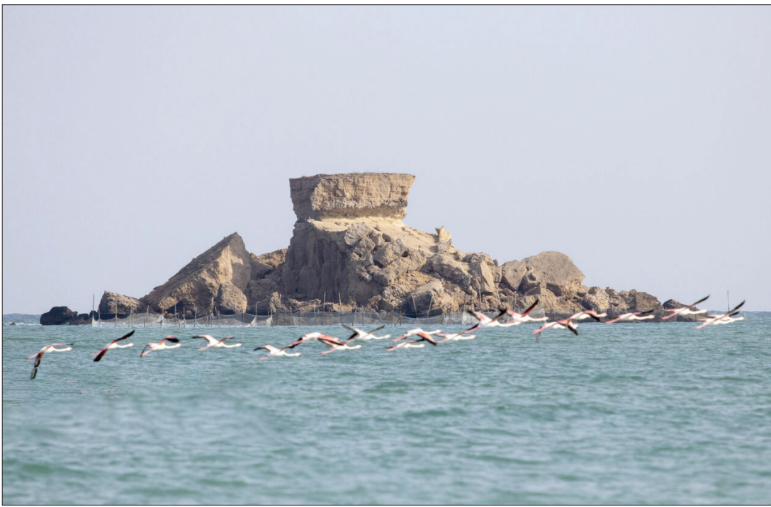
جزایر ناز از جاهای دیدنی استان هرمزگان است و در جنوب شرق جزیره قشم قرار دارد.