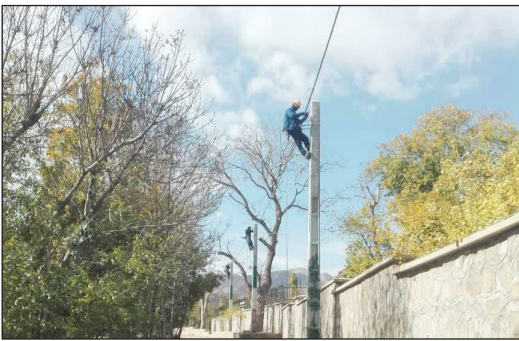
حافظی تصریح کرد: بهینه سازی شبکه توزیع برق روستاهای آیمند، فولادمحله، هیکو، رودبارک، چاشمش، مجموعه کارگاه های کوچک

وی خاطرنشان کرد: تبدیل شبکه سیمی خیابانهای شهید فیاض بخش، دشت مون، مازندران، ساری، زارعی، شهید بهشتی و شهرک ولیعصر عج شهیمرزاد، بهسازی شبکه خیابانهای انقلاب و رسالت شهر در جزین، نصب پنج ایستگاه هوایی توزیع برق برای تامین برق متقاضیان جدید، بهسازی سرخط فشار متوسط زمینی انقلاب ۲ و احداث یک هزار و ۴۰۰ متر شبکه فشار متوسط هوایی جهت تامین برق متقاضیان جدید، در زمره برنامه های این مدیریت تا پایان اسمال است.