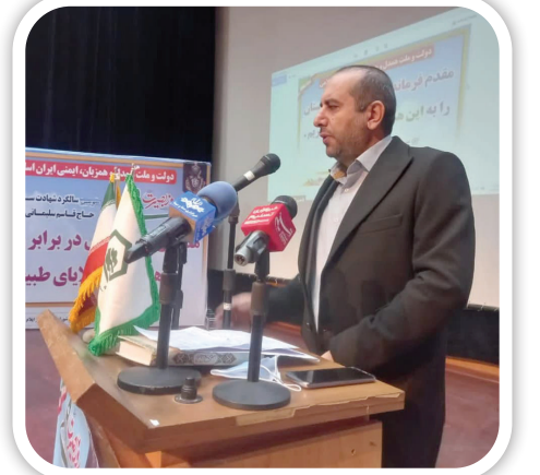
شهردار ایلام اقدامات و عملکرد مجموعه شهرداری ایلام در طی هشت ماه گذشته را تشریح کرد.

تصویری، پیگیری اجرای پروژه میدان استاندارد دیوار حایل جنب آتش نشانی ساختمان، بازسازی میدان ارغوان، اجرای سیستم اداری چغاسبز، پارک تیش بند، اجرای سقف کاذب، شبکه اتوماتیون اداری، نصب درب و سیستم گرمایشی، ایجاد ۹ چشمه سرویس بهداشتی در ورودی ارغوان و نصب علائم ترافیکی و رنگ آمیزی در سطح شهر همراه با نصب تابلو دیوار کوب علائم راهنمایی و راهنگری نصب چراغ های راهنمایی بلوار مدرس، میدان معلم، بازسازی ترمینال شهدای ایلام شامل تأسیسات برقی، مکانیکی، کفپوش، رنگ آمیزی، تهویه سرویس های بهداشتی و استراحتگاه رانندگان سواری، طراحی پل عابر پیاده در میدان میلا، تولید قطعات بتنی شامل موزاییک و دال بتنی و جدول، تولید ۵۱ هزار تن شن، ماسه و بیس در کارخانه - پیگیری واخذ ۵۰ میلیارد تومان اعتبار برای ساماندهی ورودی های شهر و پایش تصویری از محل در آمدهای استانی، پیگیری و واخذ ۱۰ میلیارد تومان اعتبار برای موضوع آرمین و همچنین بخشی از آن برای بهسازی سیلیندهای شهر، قرارداد پایش تصویری خرید تجهیزات دکل و