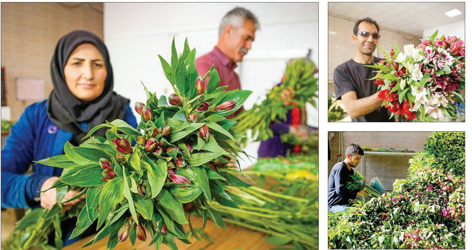
پرورش گل آلسترومیرا در اصفهان