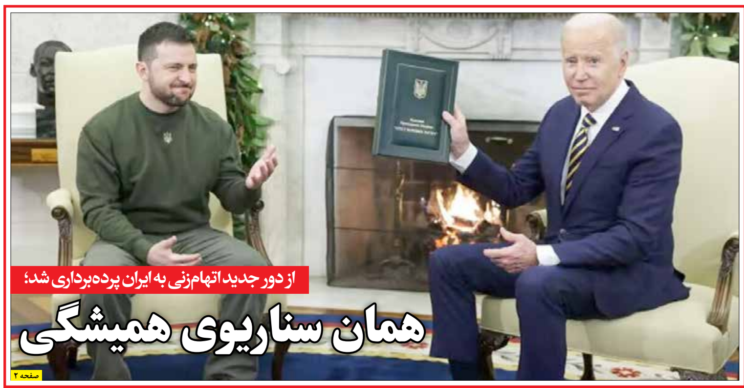
از دور جدید اتهام‌زنی به ایران پرده برداری شد؛ همان سناریوی همیشگی

نوسانات قیمت دلار و یورو در تهران دومین قربانی را هم گرفت و با استعفای علی صالح آبادی، محمدرضا فرزین سکندار بانک مرکزی شد. پیش از برکناری صالح آبادی، معاون ارزی او هم به دلیل بالا رفتن نرخ ارز و کاهش ارزش پول ملی در روز