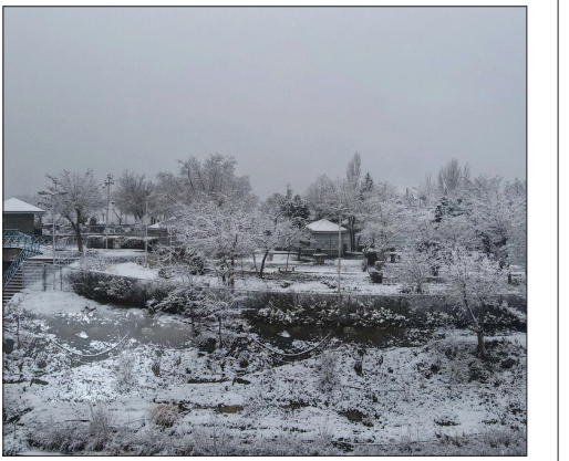
▲ طبیعت برفی دامنه الوند – همدان