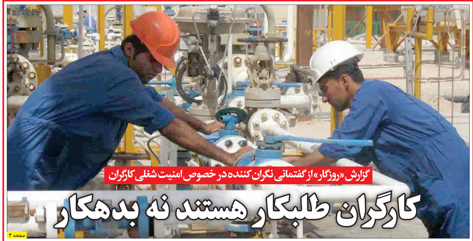
گزارش «روزگار» از گفتگمانی نگران کننده در خصوص امنیت شغلی کارگران

تحلیل و نتیجه گیری از تازه ترین دیدار برجامی هر چند زود به نظر می رسد اما همین دیدار ارسال سیگنالی است که نشان می دهد غرب پس از بی نتیجه ماندن پروژه اغتشاش پروری در ایران، آرام آرام بر سر عقل و واقع گرایی می آید. سفر حسین