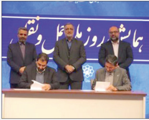
اصلی این رویداد ارزشمند خواهد بود. وی ادامه داد: مطابق تفاهم منعقد شده با تولیدکنندگان

برای اولین بار در کشور، تفاهم نامه ای سه جانبه مابین بانک، شهرداری مشهد و تولیدکنندگان موتور سیکلت برقی به منظور بهینه سازی نساوگان حمل و نقل موتوری شهر مشهد و در جهت کاهش آلاینده های زیست محیطی منعقد شد.