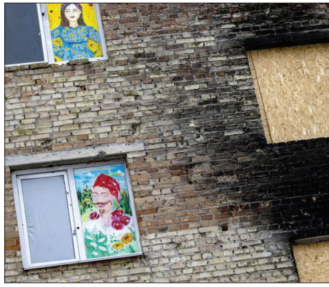
▲ نقاشی روی زخم های جنگ اوکراین