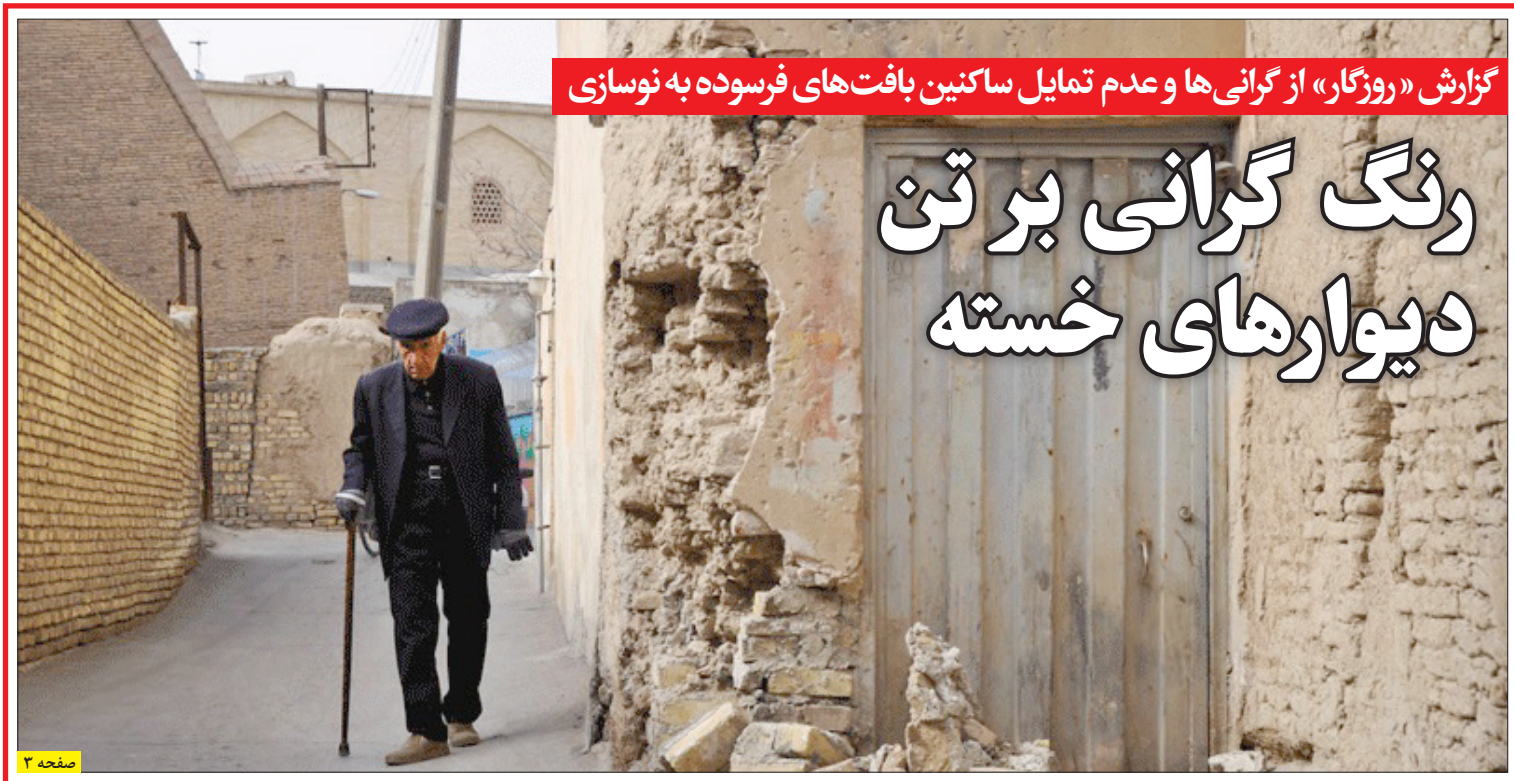
گزارش «روزگار» از گرانی‌ها و عدم تمایل ساکنین بافت‌های فرسوده به نوسازی