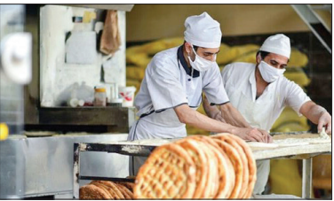
نارضایتی از هوشمندسازی بارانه نان افزایش یافت