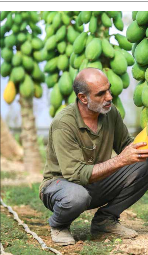
▲ تولید پایا میوه استوایی ناشناخته در همدان