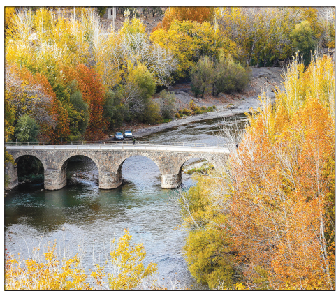
طبیعت پاییزی شهر سامان