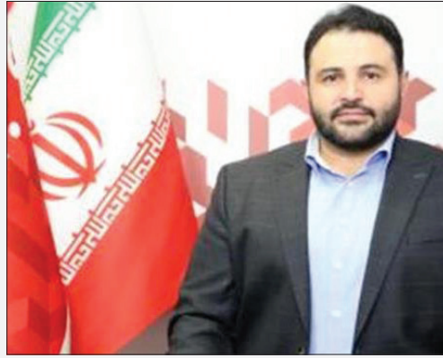
گرفته است. مدیرعامل بانک شهر با بیان اینکه از ابتدای سال جاری تاکنون نیز شاهد تغییرات بزرگ و اقدامات تاثیرگذار برای پیشرفت