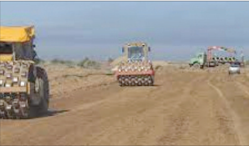
خوزستان / گروه استان‌ها: رییس سازمان