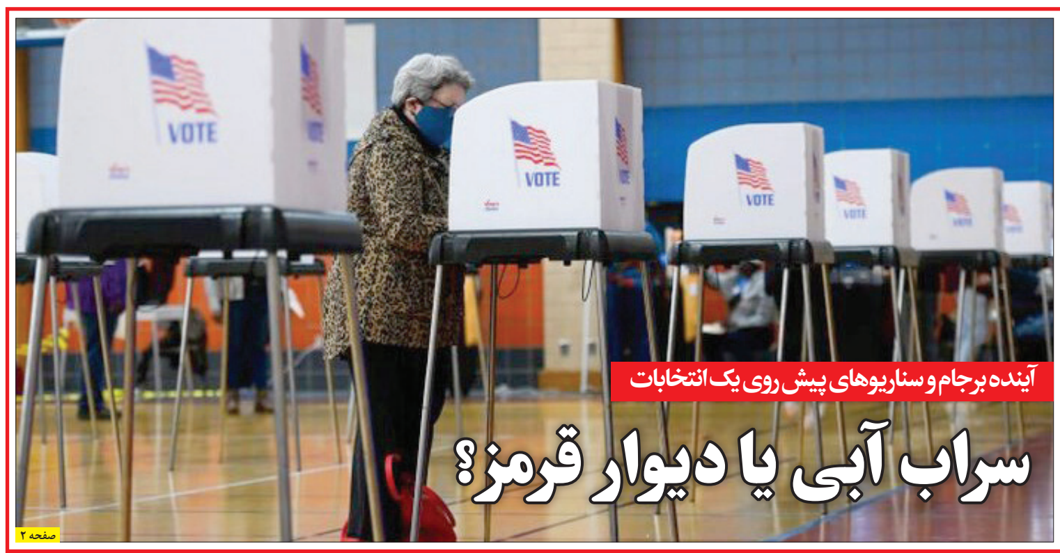
آینده برجام و سناریوهای پیش روی یک انتخابات

دولت باید جلوی هیولای نقدینگی را بگیرد تا پیش از این پیشروی نکند؛ در ضمن عقب ماندگی مزد را جبران کند؛ هیچ راه دیگری وجود ندارد. افزایش نرخ دلار در حالیکه قرار بود بعد از تخلیه اثرات یارانه زدایی شاهد تثبیت بازارها باشیم، طبقات فرودست را نسبت