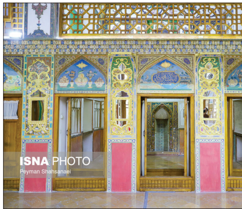
خانه تاریخی اژه‌ای‌ها در اصفهان