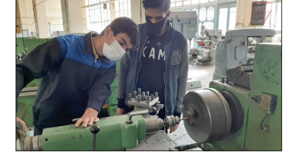
مهارت آموزی به دانش آموزان همچنان با درهای بسته مواجه است