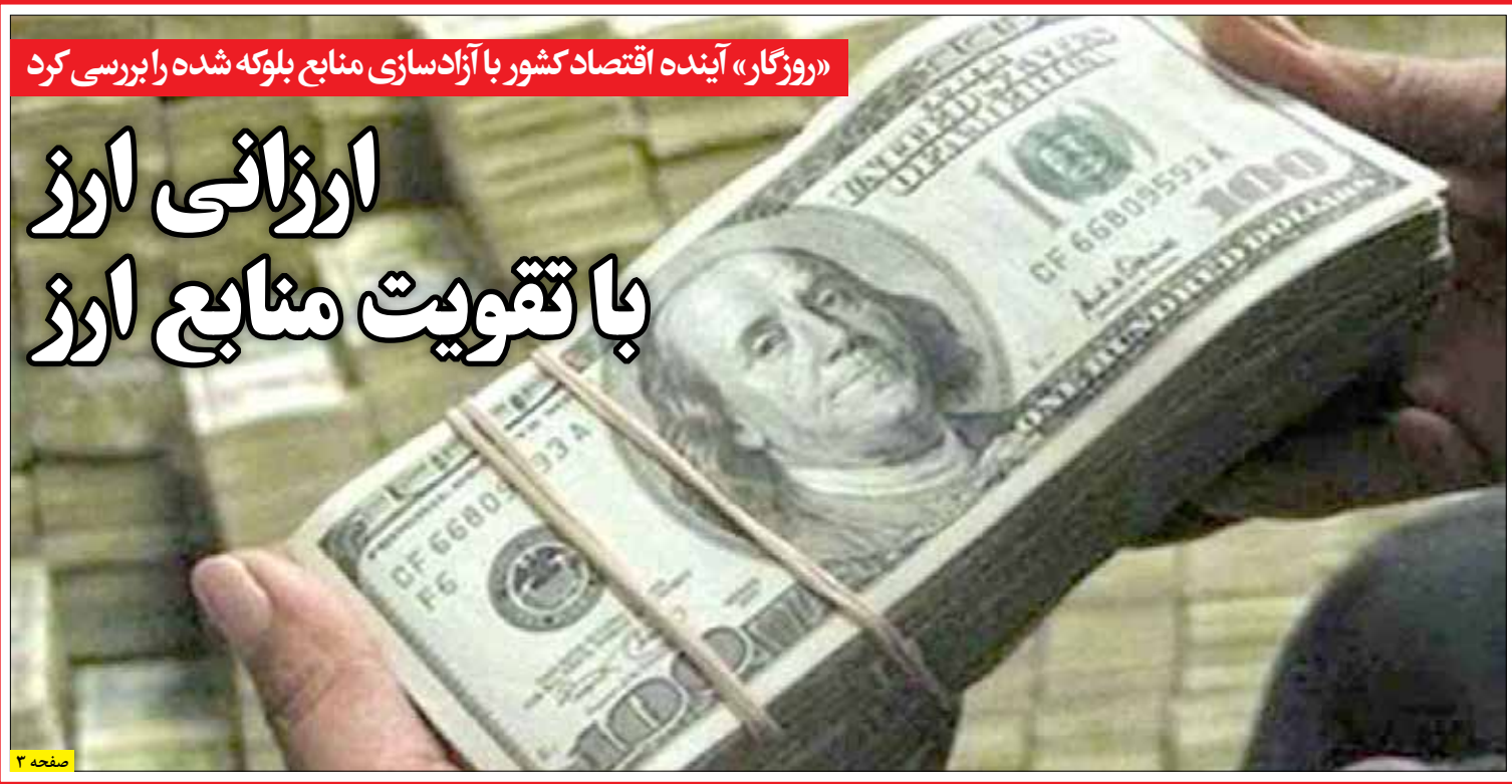
«روزگار» آینده اقتصاد کشور با آزاد سازی منابع بلوکه شده و بررسی کرد

موضوعی که در زمان پیروزی انقلاب و همچنین دفاع مقدس نیز بارها به اثبات رسید و شهر های کردستان که در زمان دفاع مقدس حدود ۲۶ بار هدف حملات و حشیشانه رژیم بعث قرار گرفته بود حدود ۲۶ هزار شهید نیز تار اسلام و انقلاب کرد. مقام معظم رهبری نیز بارها به آن اشاره کردند ایشان در ۲۲ اردیبهشت سال ۸۸ در میدان آزادی سنددج خطاب به مردم کردستان عنوان کردند: «مردم کرد در این استان امتحان خوبی را در این رویارویی بزرگ از خودشان نشان داده اند...»